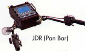
JDR (Pan Bar)