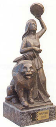
AWARD CINEC 2004