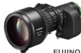
FUJINON HZK 24-300