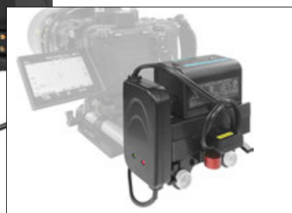
SONY BP-U60/U35バッテリーに対応(三和仕様) カメラアクセサリなどDタップ電源の供給も可能