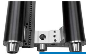
ギアラックレール

ギアラックレールは受け歯が正確に配置され、ギアと緩みなく噛み合えるよう設計されており、連結部分は非常にスムーズでシームレスに走行します。