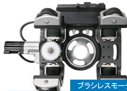
ブラシレスモーター

背面のモーターユニットにはブラシレスモーターを採用。電子回路内蔵により、速度制御や管理が可能。薄型軽量でトルク性能も安定しているため、カメラスライダーにとって最適な選択となっています。