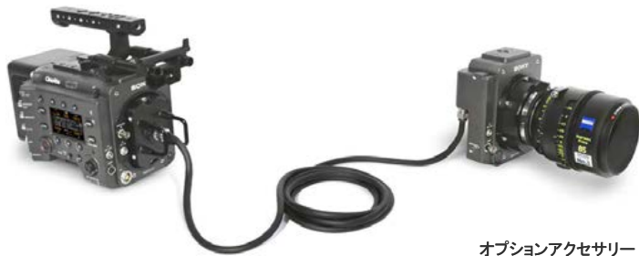
オプションアクセサリ VENICE エクステンション システム

⚠ エクステンションシステム・レンズ・AXS-R7レコーダー・その他カメラアクセサリは 別途レンタル品です。