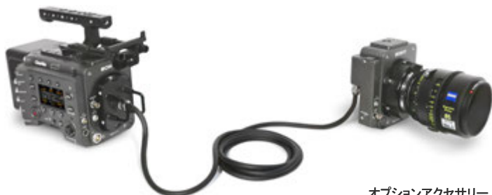
オプションアクセサリ VENICE エクステンション システム

▲ エクステンションシステム・レンズ・AXS-R7レコーダー・その他カメラアクセサリは 別途レンタル品です。