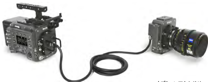
オプションアクセサリ VENICE エクステンション システム

▲ エクステンションシステム・レンズ・AXS-R7レコーダー・その他カメラアクセサリは 別途レンタル品です。