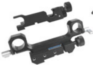
φ19mm ロッドアダプター