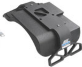
GSP-1 ショルダーパッド