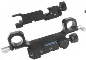
φ19mm ロッドアダプター