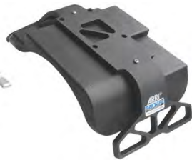
GSP-1 ショルダーパッド