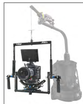
・イージーリグとの組み合わせ