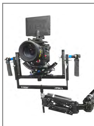
・ステディカムとの組み合わせ

『ツイスター』は、ステディカム・イージーリグなどに使用可能なカメラ用フレームです。同社Betz Tools製ですので、WAVE1との相性が良いのが特長です。